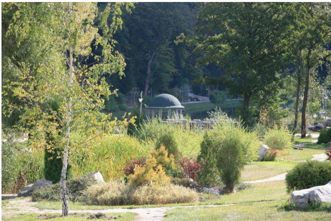
Парк-пам'ятка садово-паркового мистецтва «Феофанія»

Екскурсія «Біотопи парку «Феофанія» ДУ «Інститут еволюційної екології НАН України»